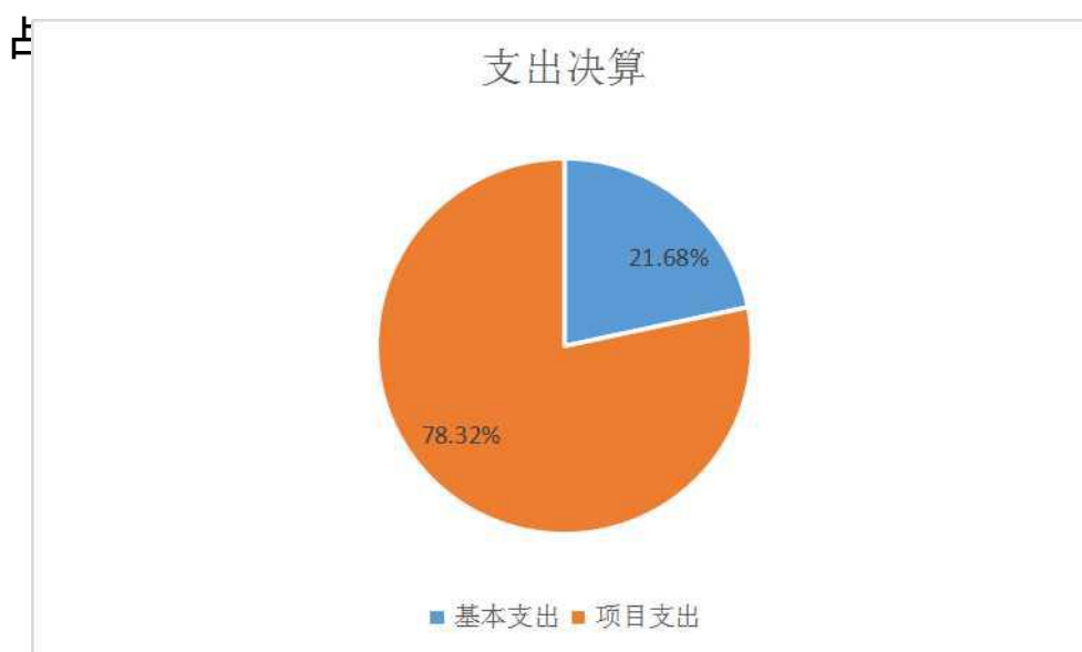
(图 3：支出决算结构图) (饼状图)

2018 年本年支出合计 2657.53 万元，其中：基本支出 576.22 万元，占 21.68%；项目支出 2081.31 万元，占 78.32%；上缴上级支出 0 万元，占 0%；经营支出 0 万元，占 0%；对附属单位补助支出 0 万元，