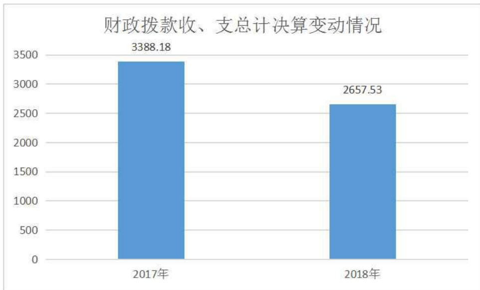
(图4：财政拨款收、支决算总计变动情况) (柱状图)

2018年财政拨款收、支总计2657.53万元。与2017年相比，财政拨款收、支总计各减少730.65万元，下降21.56%。主要变动原因是博物馆展厅改展项目完工改展经费减少。