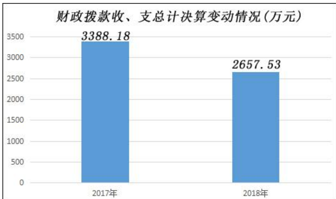
(图5：一般公共预算财政拨款支出决算变动情况)(柱状图)