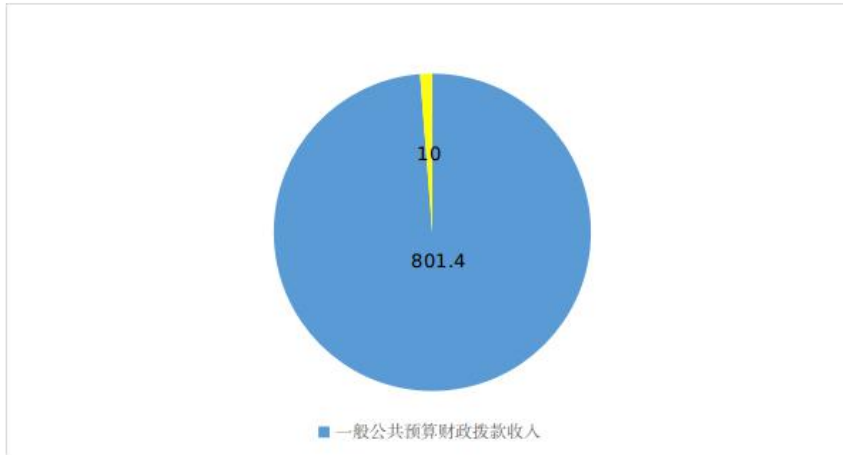
图 2：收入决算结构图