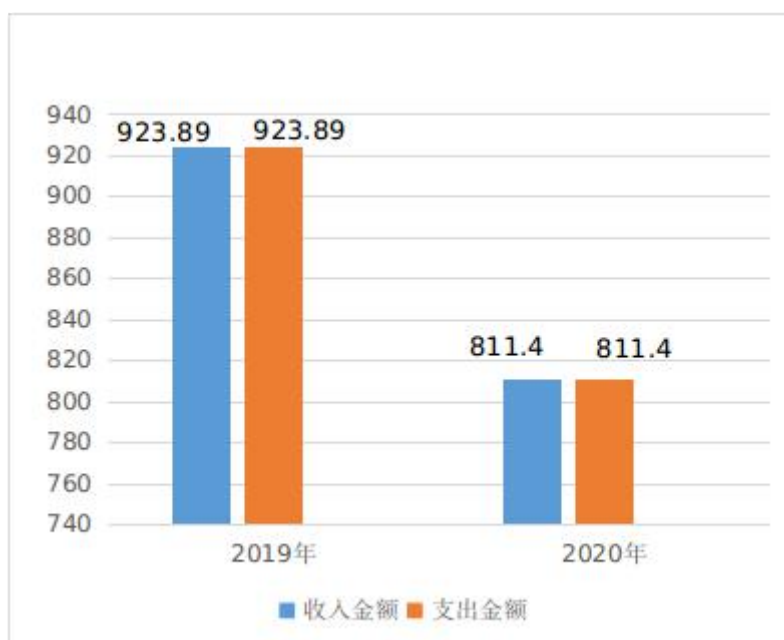
图 1：收、支决算总计变动情况图

2020 年度收、支总计 811.40 万元。与 2019 年相比，收、支总计各减少 112.49 万元，下降 12.18%。主要变动原因是单位厉行节约，压缩项目，减少项目经费；受疫情影响，需外出项目和人员集会项目减少。