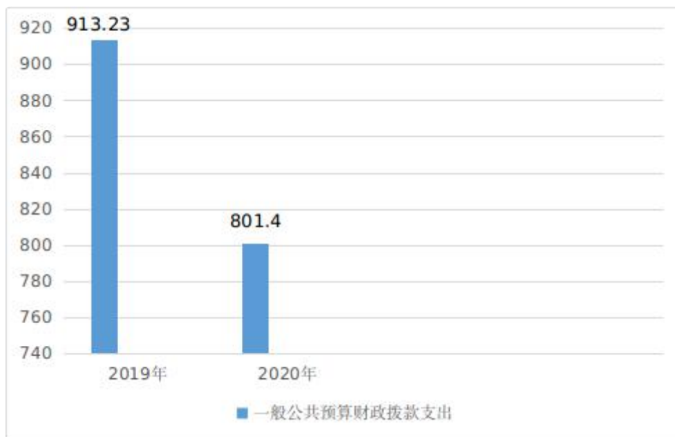
图 5：一般公共预算财政拨款支出决算变动情况图