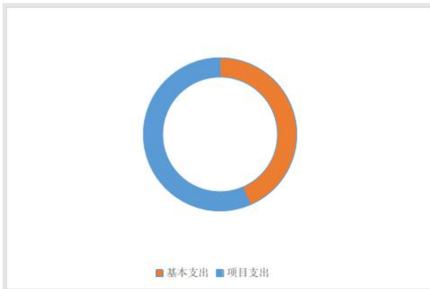
图 3：支出决算结构图

2020 年本年支出合计 811.40 万元，其中：基本支出 353.60 万元，占 44%；项目支出 457.80 万元，占 56%；无上缴上级支出、经营支出、对附属单位补助支出。